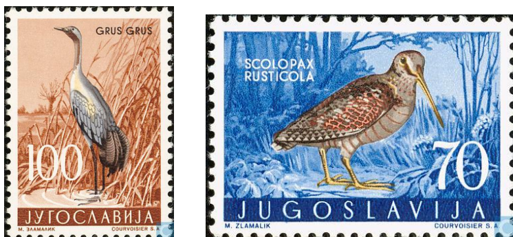
Afbeelding 3 Voorbeeld van een afbeelding met een te grote en ongelijke zwartrand en scheef. Vaak corrigeert een gepassioneerde beheerder de afbeelding of voert een andere gebruiker een nieuwe afbeelding in. Jammer want het hoeft de eerste invoerder niet veel meer werk te kosten.

Met de zwartrand die gelijk en voldoende is om de tandingen te zien en een rechte afbeelding